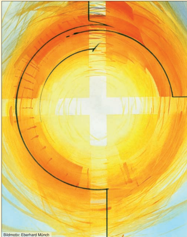
Bildmotiv: Eberhard Münch

Das Osterlicht ist der Morgenglanz nicht dieser, sondern einer neuen Erde